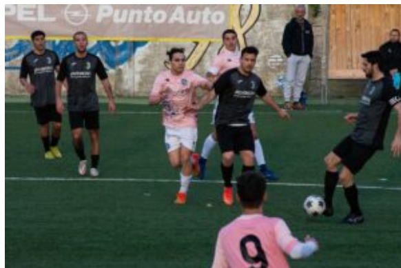
Un momento di Colle 2006- Chiaravalle