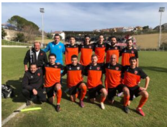
La Labor 2022-2023