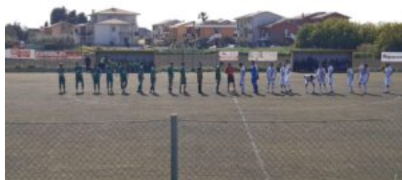
Il pre-gara di Loreto-Real Cameranese