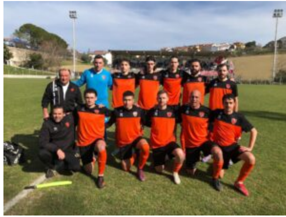
La Labor 2022-2023