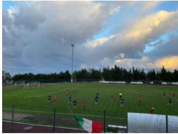
Un momento di Cingolana SF- Montemilone Pollenza