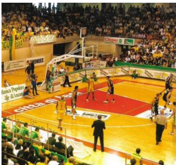
Sicc Jesi – Visrtus Bologna 2004